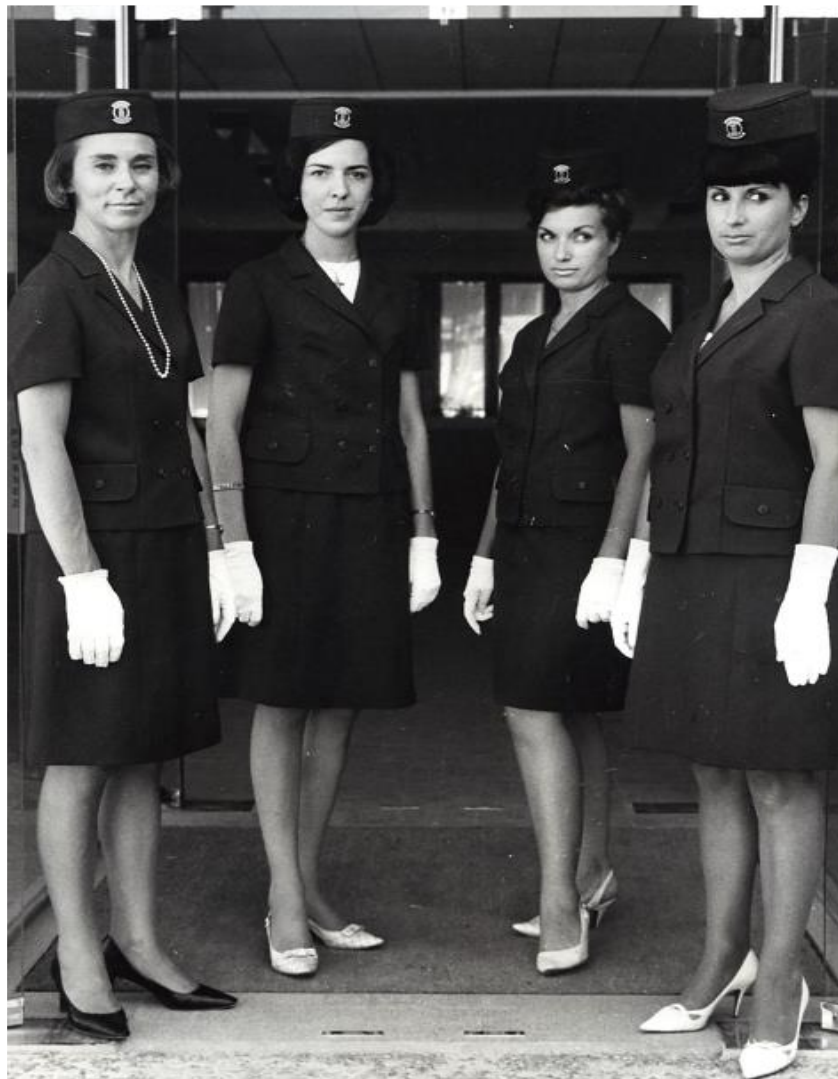
Uniforme des hôtessees d'accueil (1964)