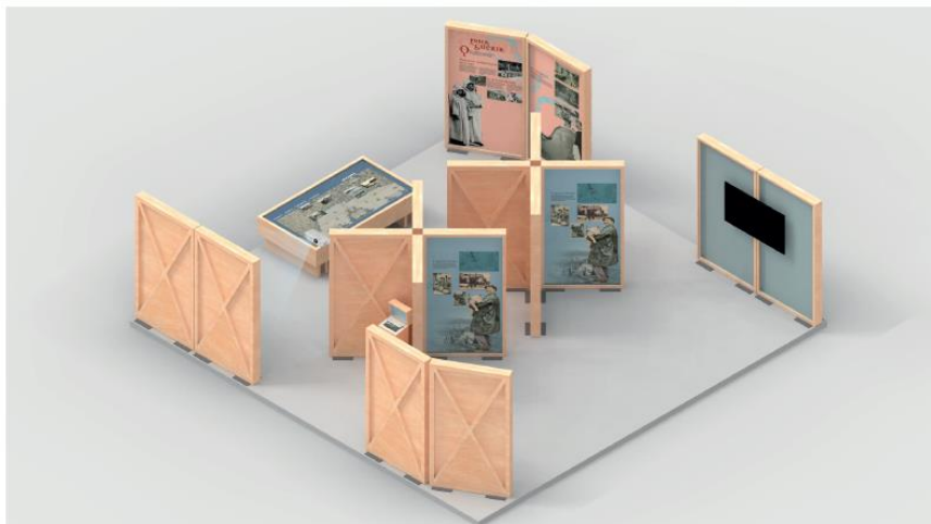
03- 50 M 2 - FORMAT CARRÉ