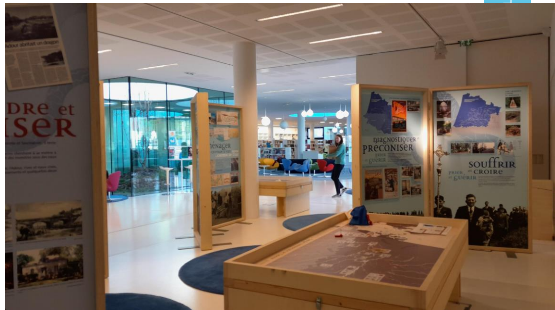
Exposition Adour accueillie à la Médiathèque de Tarnos, sur le territoire du Seignanx

En 2023, 14 projets ont été accompagnés, rassemblant 22 000 visiteurs.